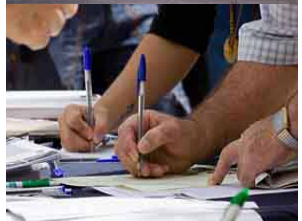
RECOGIDA DE FIRMAS PARA PEDIR LA REALIZACIÓN DE UNA AUDITORÍA