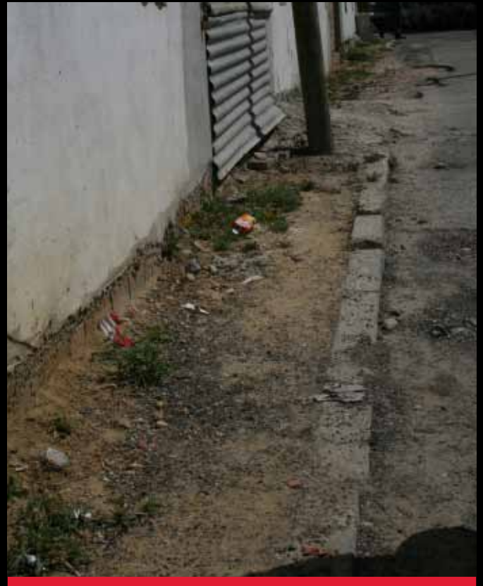
ACERAS ROTAS Y BACHES POR TODOS SITIOS, COMO EN LA CALLE SIETE REVUELTAS