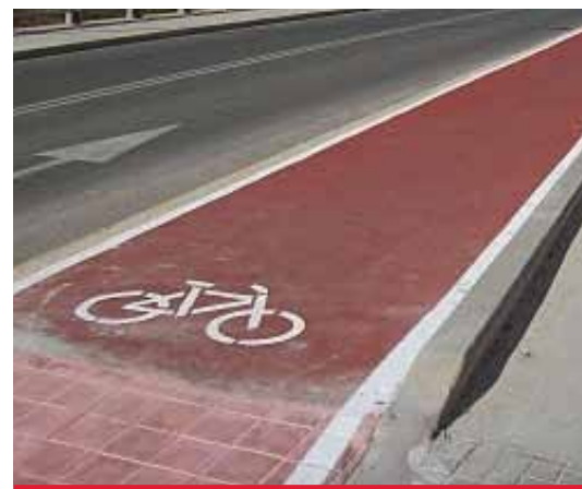
IU APUESTA POR EL CARRIL BICI

9 Rediseñar los itinerarios para que su nuevo diseño, permita un mayor uso del transporte colectivo, lo que tiene que significar un abaratamiento del coste, manteniendo las actuales bonificaciones. Asimismo se investigará cuantas posibilidades existan para conseguir subvenciones y ayudas para esos cambios.