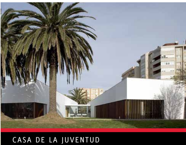
CASA DE LA JUVENTUD