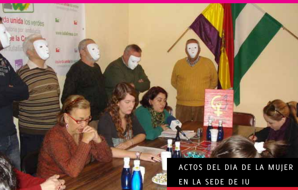
ACTOS DEL DIA DE LA MUJER EN LA SEDE DE IU

Desde su fundación, Izquierda Unida incluyó dentro de sus ejes programáticos y elementos definitorios: la asunción de la lucha por la igualdad entre hombres y mujeres y, en consecuencia, la obligación de trabajar por un modelo social igualitario.