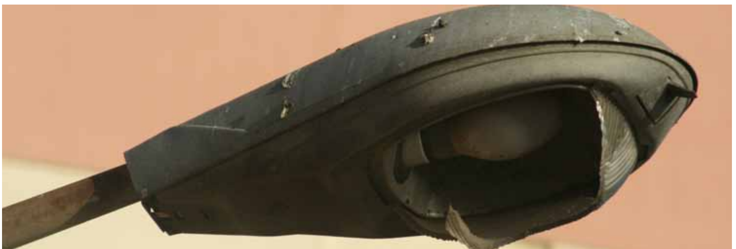
ESTADO DE LAS LUMINARIAS EN LA AVENIDA ESPAÑA

- Y para poder conseguir sus objetivos han intentado por todos los medios domesticar y condicionar a los Partidos, Sindicatos, Colectivos Sociales y a los Medios de Comunicación. Y especialmente les ha servido en todo ello la utilización partidista y demagógica de determinados programas y trabajadores de la Radio Televisión Municipal, cuya financiación y coste anual supera el millón de euros, que por cierto, pagamos todos.