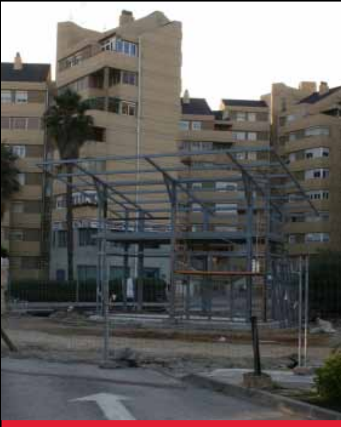
CONCESIÓN DEL BULEVAR, ANTES DE QUE OCUPARAN LA AVENIDA 20 DE ABRIL