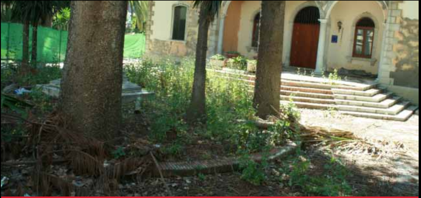
EL DISPARATE DE CAMBIAR NUESTRA CASA CONSISTORIAL: ESTADO ACTUAL DE LO QUE UN DÍA FUE EL AYUNTAMIENTO DE LA LÍNEA