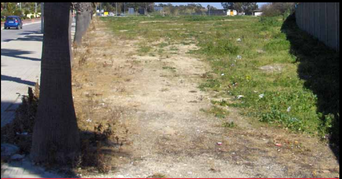
TERRENOS DEL CASO ROSEWORLD, QUE ANTES DE VENDERLOS FUERON DEL PUEBLO DE LA LÍNEA