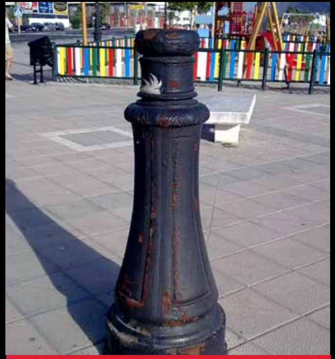
NO, NO ES UNA PAPELERA. ES UN TROZO DE FAROLA EN EL PASEO MARÍTIMO DE PONIENTE