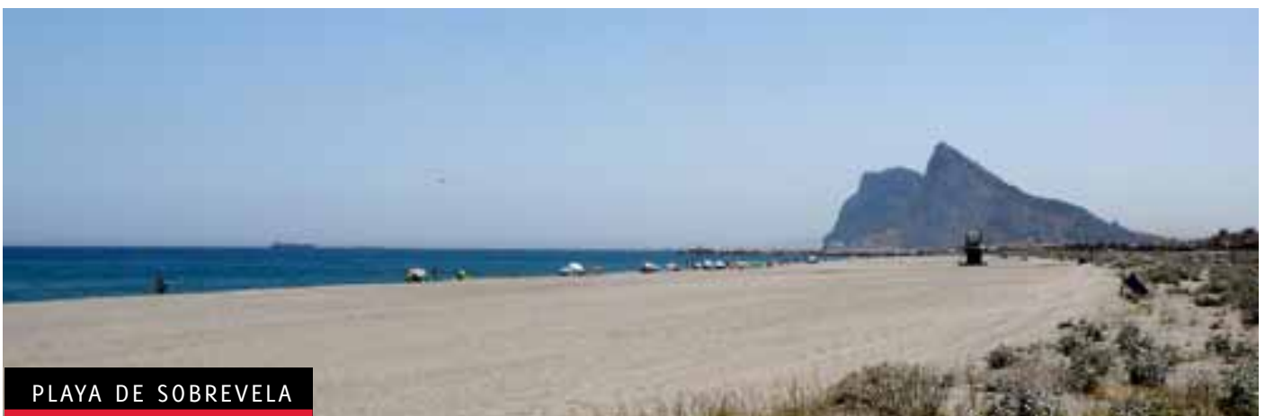
PLAYA DE SOBREVELA

5 Teniendo en cuenta todo lo anterior y partiendo de las infraestructuras y servicios ya consolidados, se introducirán aquellas mejoras y adaptaciones que hagan posible, el respeto a los objetivos antes mencionados