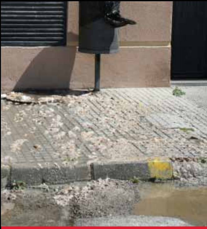
AGUAS FECALES QUE NO TIENEN SOLUCIÓN. EN LA FOTO: CALLE LOS CAIRELES, MONDEJAR