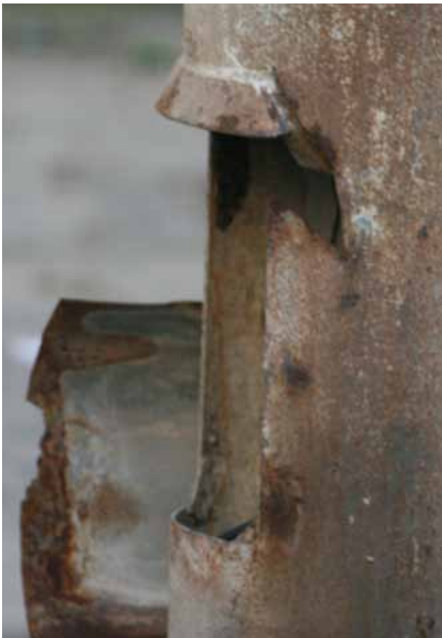
ESTADO DEL ALUMBRADO EN LA AVENIDA DEL EJÉRCITO, CENTRO DE LA CIUDAD