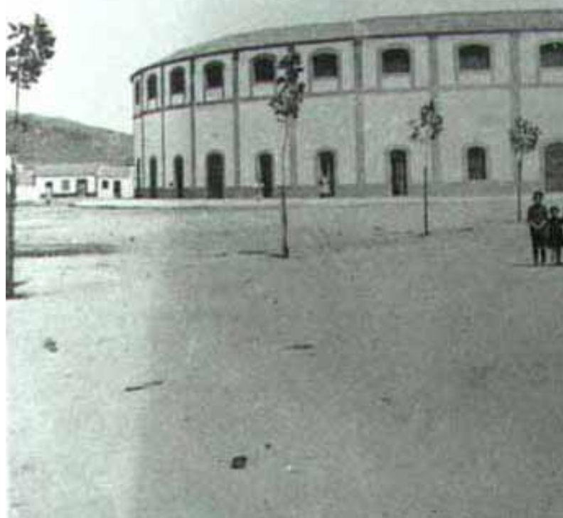
NUESTRA PLAZA DE TOROS EN 1910

La situación actual es muy preocupante al respecto , ya que esa practica no solo constituye quizás la más acabada representación del proceso de privatización del ámbito de lo público, sino porque viene realizándose de manera cada vez mas descarada, provocando situaciones de hecho que